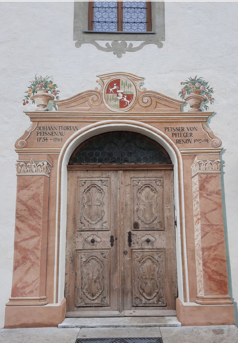
Alte Elemente bleiben in der Adaptierung erhalten.